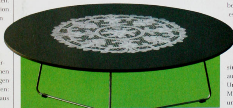
Clubtisch Melange: Die weisse Spitzendecke ist aufgedruckt.