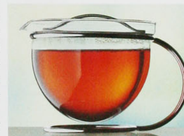
Oben: Im Ambiente-Tavola-Fachgeschäft entdeckt:

Ambiente-Tavola-Fachgeschäfte: www.ambiente-tavola.ch