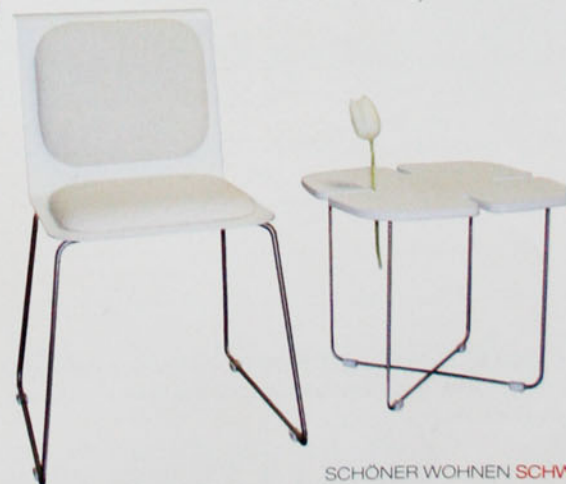
Alustuhl Lovely, Beistelltisch Lucky. Ganz rechts: Stehleuchte Koia